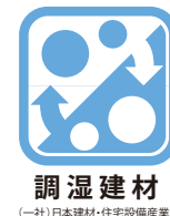
調湿建材 （一社）日本建材・住宅設備産業協会

室内の湿度が高いと湿気を吸収し、乾燥すると湿気を放出するエコカラットは、「調湿建材」として、一般社団法人日本建材・住宅設備産業協会より登録を取得しています。